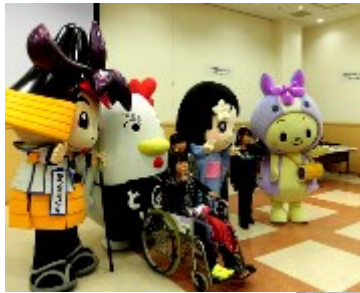
↑ご当地キャラと記念撮影

刈谷市・知立市・高浜市・東浦町のボランティアセンターが集合し、ボランティアセンター及びつながるねっとのPRイベントを行いました。当日は大勢のお客様に来場いただき、大盛況でした。