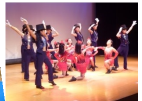
↑ステージショーの様子